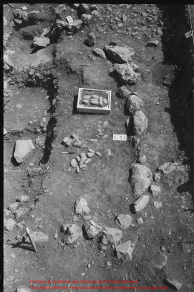
Restes de la Maçon des Sarcophages de l'Église de Saint-Jacques Travaux de fouilles effectués par le Service des Monuments et Sites de la Ville de Paris