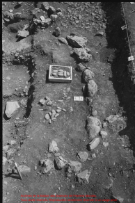
Restos de la tumba del Conde de Oñate en Madrid.