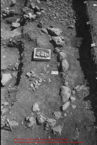
Excavation de la station de la Vallée de l'Estuaire de l'Anse-au-Loup Traces de la culture de la Vallée de l'Estuaire de l'Anse-au-Loup à un usage privé