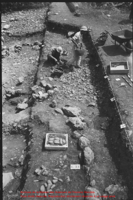
Excavation of the Temple of the Sun at the site of the Temple of the Sun, showing the stone blocks and the person standing in the trench. The number '153' is visible on the ground.