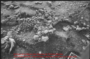
Artifices de la Maison des Sciences de l'Homme Monde. Tous droits réservés. Reproduction strictement réservée à un usage privé