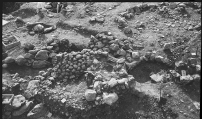
Archéologie de la Maison des Sciences de l'Homme Mondes. Tous droits réservés. Reproduction strictement réservée à un usage privé