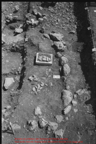
Restos de la Misión del Comercio del Puerto Meridiano. Una de las observas. Representación esquemática de un objeto que