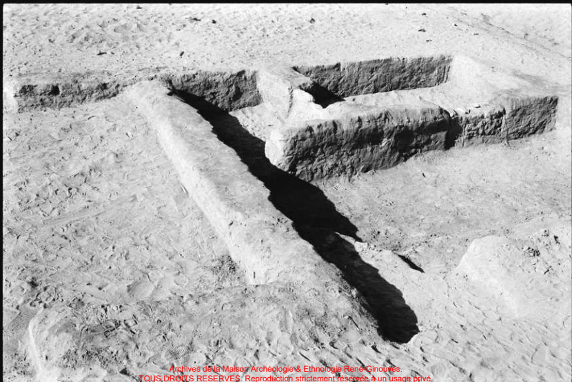
Archives de la Maison Archéologie & Ethnologie René Ginouvès. TOUS DROITS RESERVES: Reproduction strictement réservée à un usage privé.