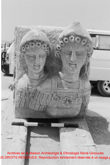
Archives de la Maison Archéologie & Ethnologie René-Ginouvès. TOUS DROITS RESERVES. Reproduction strictement réservée à un usage privé.