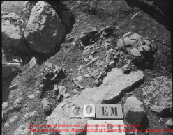
Archives de la Maison des Sciences de l'Homme Mondes. Toute autre réimpression, reproduction strictement réservée à un usage privé