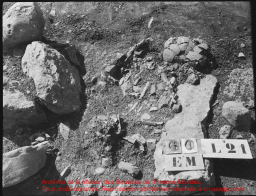
Archives de la Maison des Sciences de l'Homme Mondes. Tous droits réservés. Reproduction strictement réservée à un usage privé