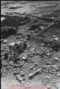
Работники на карьере при строительстве в Чилине Мьянмы. Тот, кто впереди, работает с помощью инструментов, сделанных из местного камня.