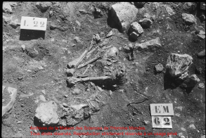
Archives de la Mission des Sciences de l'Étendue Maritime. Tous droits réservés. Reproduction strictement réservée à un usage privé.