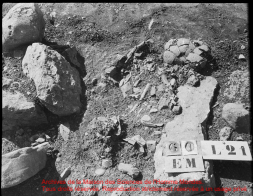
Archives de la Maison des Sciences de l'Homme blanches. Tous droits réservés. Reproduction strictement réservée à un usage privé