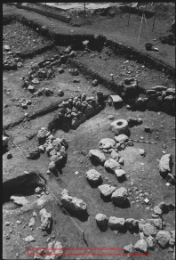
Excavation of the Temple of the Sun at the site of the Temple of the Sun, showing the remains of the temple and the surrounding structures.