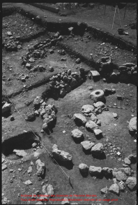
Restos de un templo de piedra en Tulum, Yucatán. Una gran cantidad de estelas de piedra se encuentran en un campo cercano.