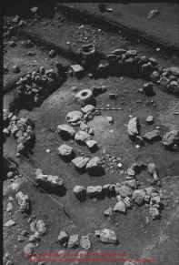
El Cerro de la Cruz en la Sierra de Guadalupe, México. Foto: André Bouchard. Reproducción autorizada por el IIA-UNAM.