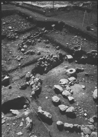
Excavation of the Mosaic and Stucco in the Temple of the Sun. The site is located in the city of Teotihuacan, Mexico.