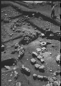
Archaeological Excavation of the Site of the Temple of the Moon This site is the site of the Temple of the Moon, which was destroyed in 1974.