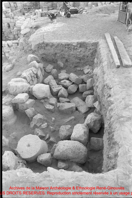
Archives de la Maison Archéologie & Ethnologie René-Ginouvès. Tous droits réservés. Reproduction strictement réservée à un usage privé.