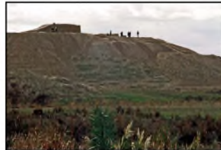
Djaffarabad. Vue générale du tepe depuis le nord-ouest, 1971.