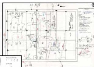
Journal graphique, 2/12/1978. (Cote : JP51)

Le chantier appelé «Acropole I» a été fouillé entre 1969 et 1979 sous la direction d'Alain Le Brun. Ce sondage avait pour but de fournir un cadre stratigraphique précis de l'occupation de Suse, des origines de l'agglomération (début du IV e millénaire) jusqu'au milieu du III e millénaire. Il a permis de reconnaître trois phases essentielles de l'évolution culturelle de Suse et de suivre les étapes, au cours de la période II, de l'invention d'un système comptable puis d'une écriture proprement dite, le proto-élamite dans le dernier tiers du IV e millénaire.