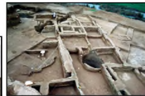
Djaffarabad. Vue générale du niveau 5, 1974. (Cote : JP2514)