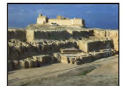
Vue générale de la «grand tranchée» de J. de Morgan face nord et de la Haute Terrasse (au premier plan), 1977. (Non coté)

Les fouilles de l'Acropole II (1971-1978) ont été conduites sous la direction de J. Perrot, D. Canal en assumant la responsabilité entre 1975 et 1977. Elles ont permis de retracer l'histoire de la Haute terrasse et de préciser sa relation avec la nécropole (IV e millénaire, période I).