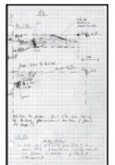
Fouilles de Djaffarabad. Extrait de carnet de fouilles, 1972. (Cote : JP1)