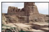
Vue générale du chantier de l'Acropole I, 1969. (Cote : JP40311)