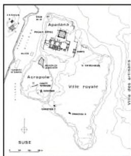
Plan général de Suse, s.d. (Cote : JP98)