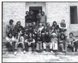
La mission de Suse lors de la campagne de 1976. (Cote : JP1333)

Réunion quotidienne où les responsables de chantier présentent les résultats de la fouille, 1976. (Cote : JP1342)