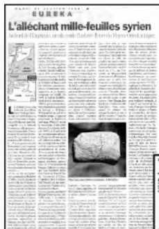
Articles relatant la découverte des rarissimes tablettes assyro-araméennes de Tell Shiukh, parus dans Libération (30 janvier 1996) et dans Le Monde (21 février 1996). (Cote : LBI/123)

Tablette assyro-araméenne, le plus long document en caractères alphabétiques araméens sur argile jamais découvert, 1995. (Non coté)