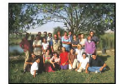
La mission de Tell Shiukh, 1996. (Non coté)