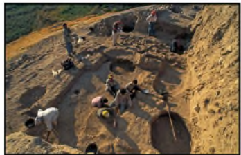
Chantier F : niveau d'habitat où fut trouvé un lot d'archives assyro-araméennes (VII e s. av. J.-C.), 1995. (Non coté)

Feuille de locus ou d'unité stratigraphique permettant une description normalisée des structures dégagées en fouille. Ici le locus où furent découvertes les tablettes assyro-araméennes, 1995. (Cote : LBI/121)