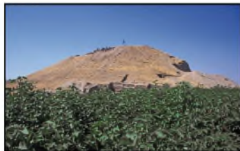
Le site de Tell Shiukh Fawqani vu de l'est, 1999. (Non coté)

Bibliographie : Luc Bachelot, Frederick Mario Fales (éd.), Tell Shiukh Fawqani, 1994-1998 , 2 vol., Padoue, Sargon, 2005.