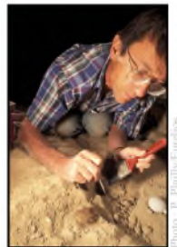
Chantier F : dégagement d'une tablette, 1998. (Non coté)