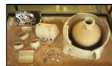
Reconstitution d'une tombe à incinération (secteur H - XII e s. av. J.-C.) au Musée archéologique national d'Alep (Syrie), 2001. (Non coté)

Auteurs : Luc Bachelot, Aurélie Montagne-Bórras, Sophie Montel. Contact : Elisabeth Bellon Service des archives scientifiques Archives Luc Bachelot, 1984-2002.