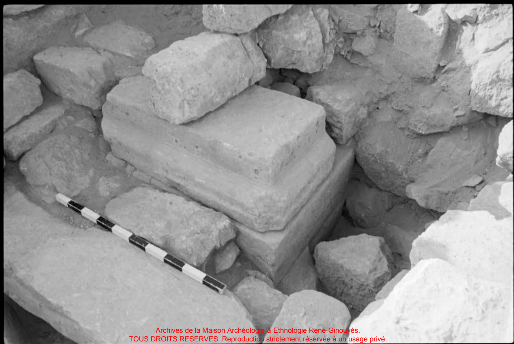
Archives de la Maison Archéologie & Ethnologie René-Ginouvès. TOUS DROITS RESERVES. Reproduction strictement réservée à un usage privé.