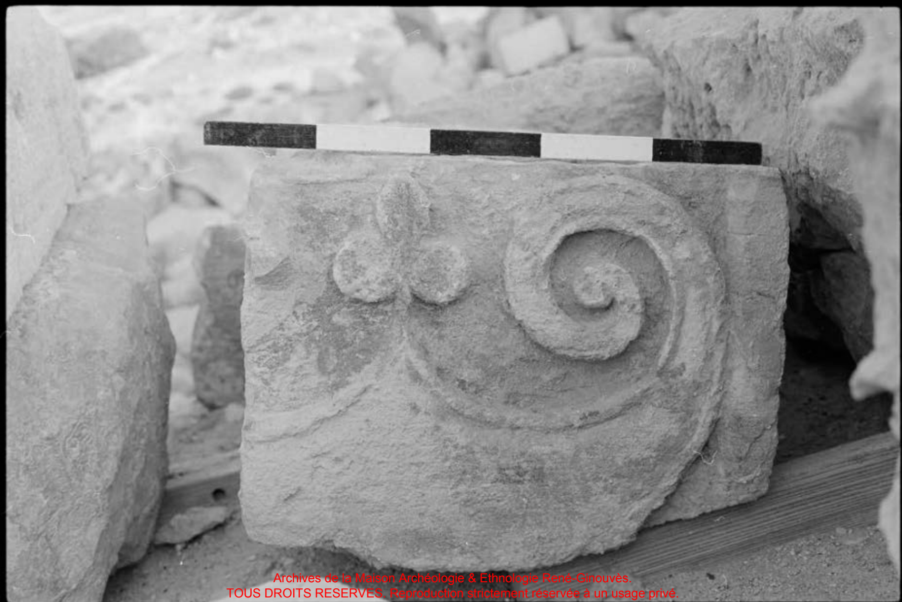
Archives de la Maison Archéologie & Ethnologie René-Ginouvès. TOUS DROITS RESERVES. Reproduction strictement réservée à un usage privé.