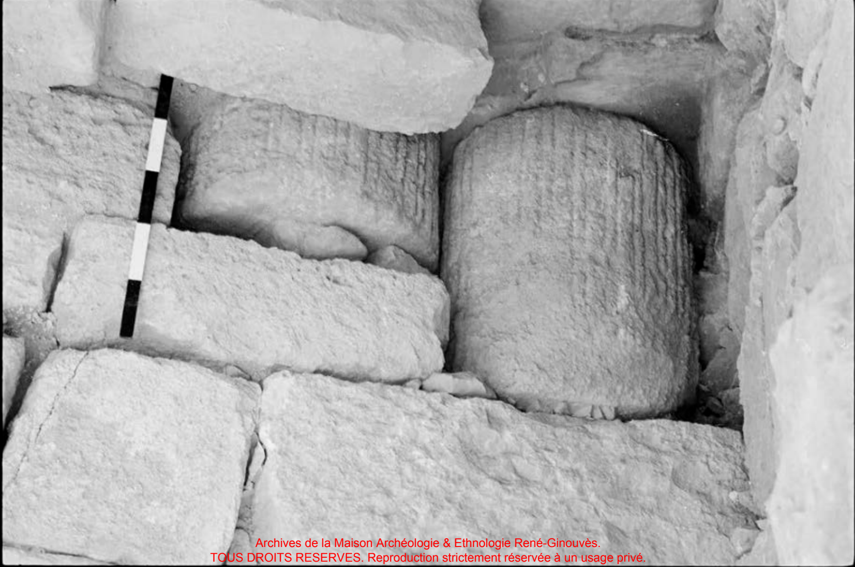
Archives de la Maison Archéologie & Ethnologie René-Ginouvès. TOUS DROITS RESERVES. Reproduction strictement réservée à un usage privé.