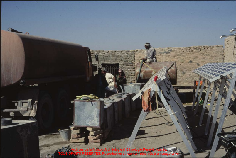
Archives de la Maison Archéologie & Ethnologie René-Ginouvès TOUS DROITS RÉSERVÉS. Reproduction strictement réservée à un usage privé.